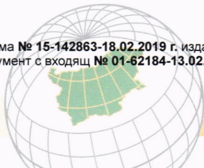
Схема № 15-142863-18.02.2019 г. издадена въз основа на документ с входящ № 01-62184-13.02.2019 г.