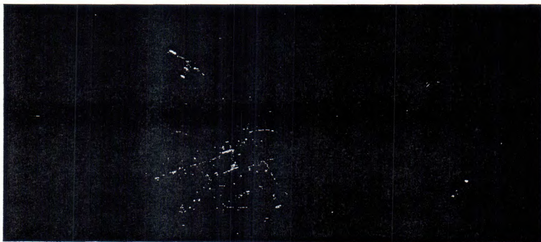
Отстояние от селото.